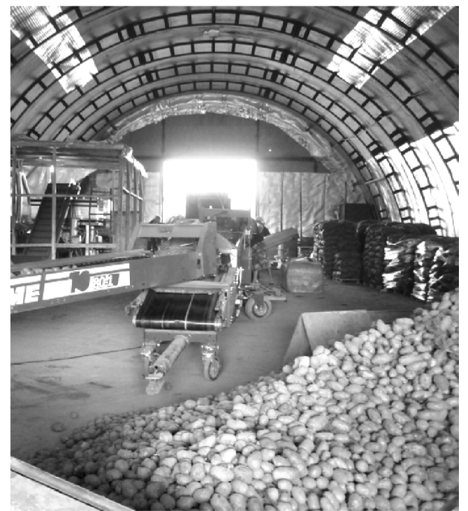
На картофельном складе ООО «Аврора».